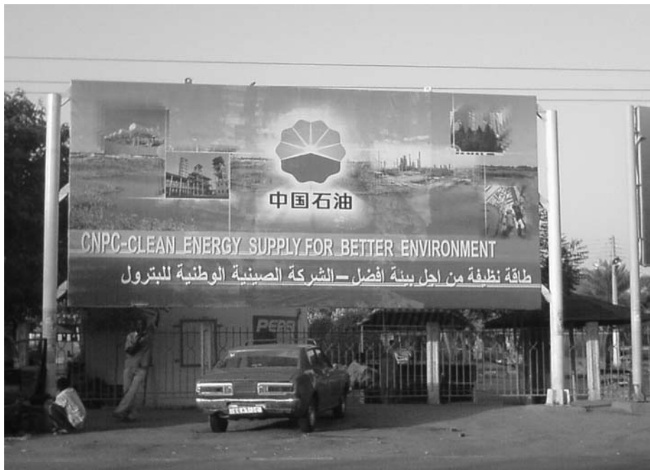
Abb. 5: Zunehmend investieren asiatische Unternehmen in die Rohstoff-Förderung in Afrika, hier die Werbetafel eines chinesischen Ölunternehmens in Khartoum, Sudan