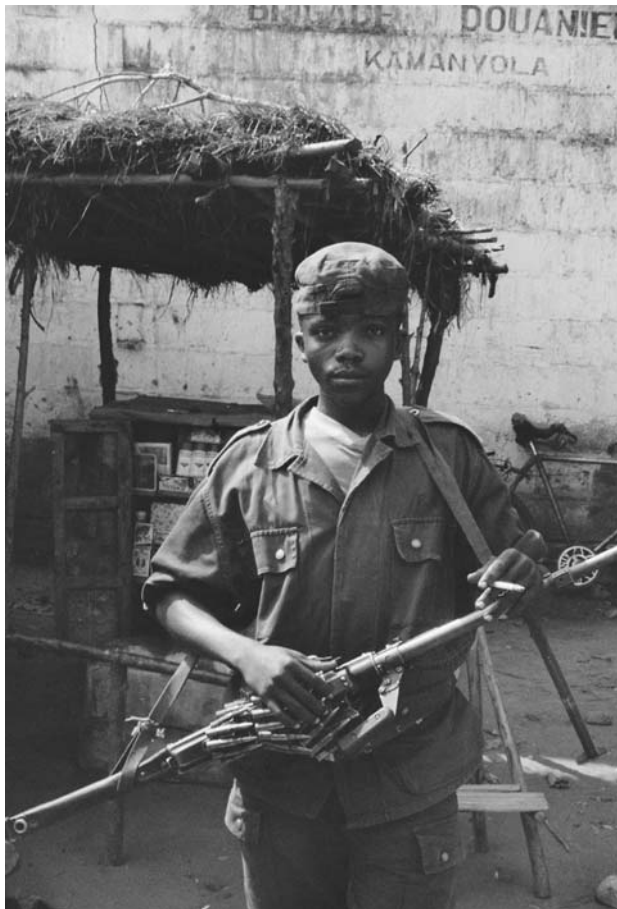
Abb. 3: Kindersoldat an einem Checkpoint in Kamanyola, DRK

Mit dem nach dem Genozid in Ruanda (und der damit verbundenen Flucht von mehr als einer Million Hutus nach Zaire) beginnenden Zerfall der Herrschaft Mobutus und der Spaltung des Landes in von verschiedenen Milizen kontrollierte Territorien ging die Vermarktung der Ressourcen auf Kriegsherren über. Dadurch veränderten sich zum Teil die Handelswege. Es kam zu unklaren Besitzverhältnissen und Auseinandersetzungen zwischen externen wirtschaftlichen Akteuren über ihre Rechte. Regionale Mächte haben sich immer wieder militärisch in die Konflikte im Kongo eingemischt. Die Kontrolle über Ressourcengewinnung und -vermarktung wurde zur Finanzierung dieser Aktivitäten genutzt; parallel kam es aber auch zur Bereicherung von Individuen in Streitkräften und Staatsapparaten. Regionale Mächte, mit rivalisierenden örtlichen bewaffneten Gruppen liiert, waren (und sind) die wichtigste Quelle für Waffen und Munition in der DRK.